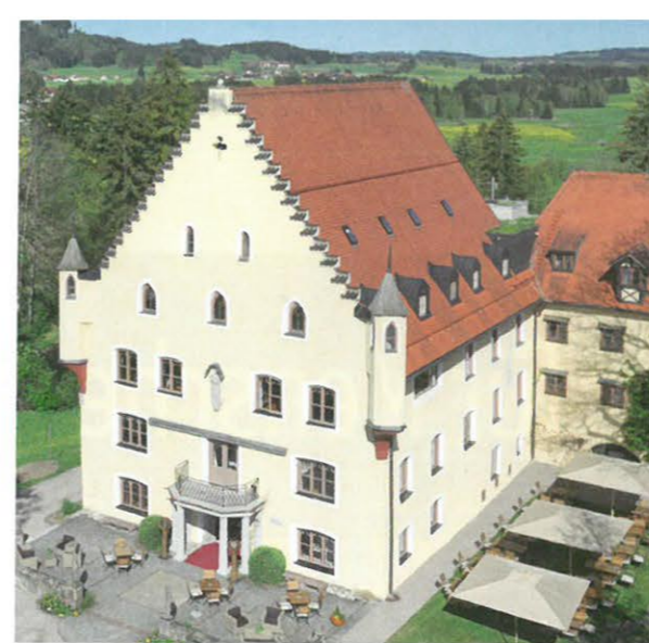
Der 15 Zimmer umfassende Logisbereich des Schlosses zu Hopferau schließt sich harmonisch an die historische Architektur des Haupthauses an und entspricht ebenfalls dem hohen Qualitätsanspruch.

Schloss zu Hopferau ist ein kleines, feines, aber keinesfalls elitäres Haus, in dem Qualität und Genuss einen hohen Stellenwert haben. Es besticht sowohl durch seine kreativ-inspirierende Geschichte wie auch die sehr private Atmosphäre. Die ungewöhnliche Veranstaltunglocation auf höchstem Niveau steht für Kultur und Kulinarik. Die exzellente Küche des Schlosses überzeugt selbst anspruchsvolle Gäste. Auf der Speisekarte sind modern interpretierte Klassiker der Allgäuer