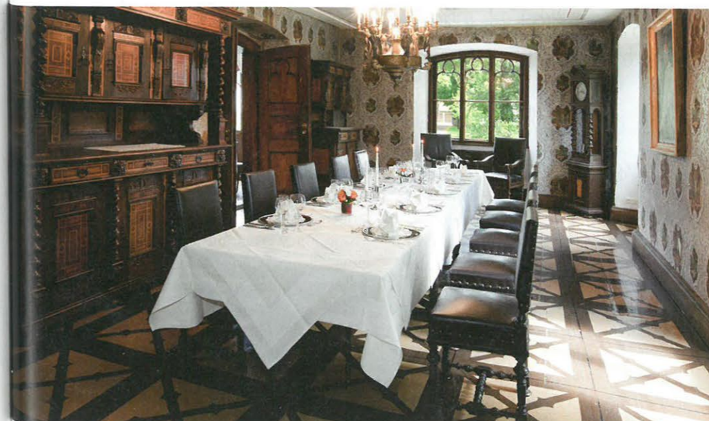
Tafeln und Tagen auf höchstem Niveau, denn Tradition verpflichtet im Schloss zu Hopferau.