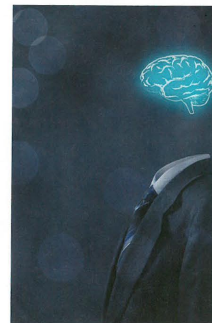
Das Zentrum für Leistungsmanagement vermittelt Führungskräfte in Vorträgen, Seminaren und Coachings, wie sie nachhaltig leistungsfähig und veränderungsbereit bleiben.

Hirnforschung und Biologie unterstützt das Zentrums für Leistungsmanagement Unternehmen nachhaltig bei der Personalentwicklung. Das Hauptaugenmerk des Programms liegt auf den Themen Führung und Change aus neurobiologischer Perspektive. Ein Team aus renommierten Ärzten, Psychologen, Sozial- und Wirtschaftswissenschaftlern sowie Managern haben eine erfolgreiche Verbindung zwischen Gehirnforschung und zukunftsfähigem Management hergestellt und vermitteln Führungskräften wie sie fit für die Anforderungen des heutigen Arbeitslebens werden bzw. bleiben und ihre Leistungsfähigkeit sowie Veränderungsbereitschaft nachhaltig steigern. Der deutschlandweit einzigartige Ansatz orientiert sich an wissenschaftlichen Zahlen, Daten, Fakten und ermöglicht erstmals Führungsqualitäten sichtbar zu machen sowie valide und evidenzbasierte Aussagen über wichtige Skills zu treffen.